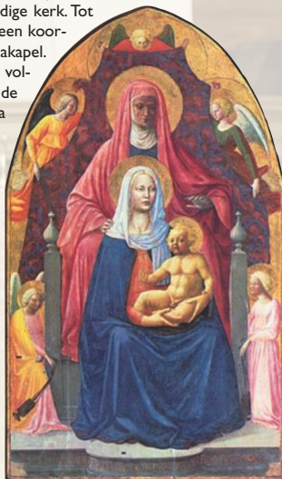
Heilige Anna, Maria en Jezus door Albrecht Dürer

De Mariakapel verwijst naar Maria, de moeder van Jezus. Met name in de late Middeleeuwen ontstond enorme belangstelling voor Maria als maagd, koningin, bruid, moeder en midde-lares. Deze verering bleef niet beperkt tot kloosters en kerke-lijke instellingen; ook in de burgerij was de Mariaverering stevig geworteld. Er werden zelfs broederschappen opgericht met het doel om de verering van Maria te bevorderen en vele kerken kregen de naam Onze Lieve-Vrouweker . In die tijd was het voor een componist dan ook een dankbare taak om een werk voor een Mariafeest te schrijven, omdat zijn compositie vrijwel zeker werd uitgevoerd.